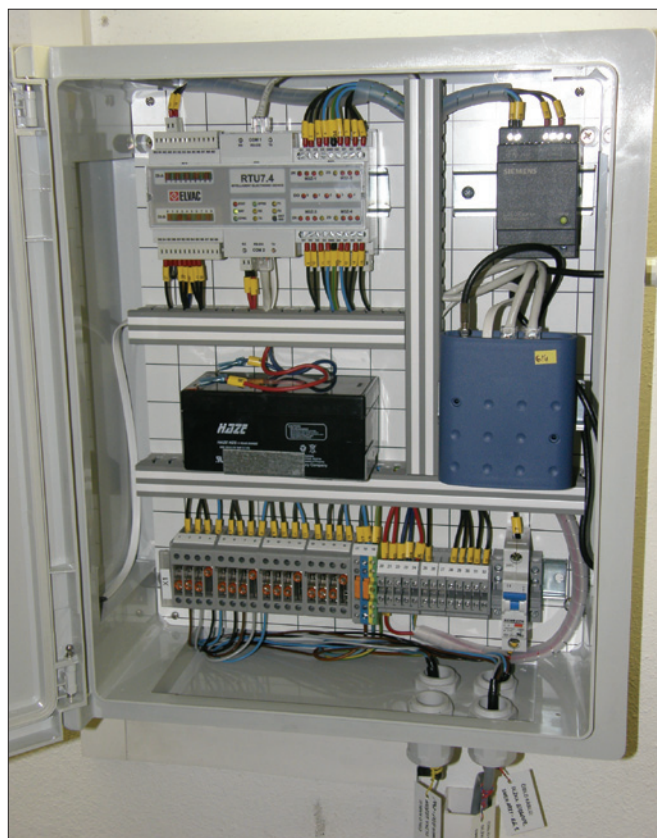
Obr. 1. Jednotka RTU pro řízení distribuční sítě a regulaci toků výkonu

veno indikátory zkratových proudů s místní signalizací, ale bez dálkového přenosu dat do dispečinku a do specializovaného pracoviště, kde je možné z naměřených záznamů o poruše zjistit její typ a možnou příčinu. Při vzniku poruchy je nutné takto vybavené stanice objíždět a stav zjišťovat přímo na místě. Obdobná situace je u úsekových (ÚS) odpí-